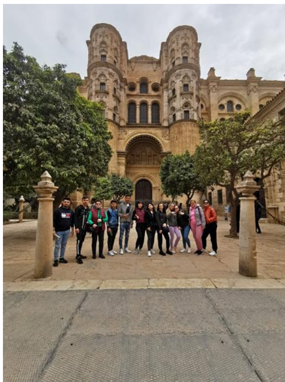
vizită în Malaga